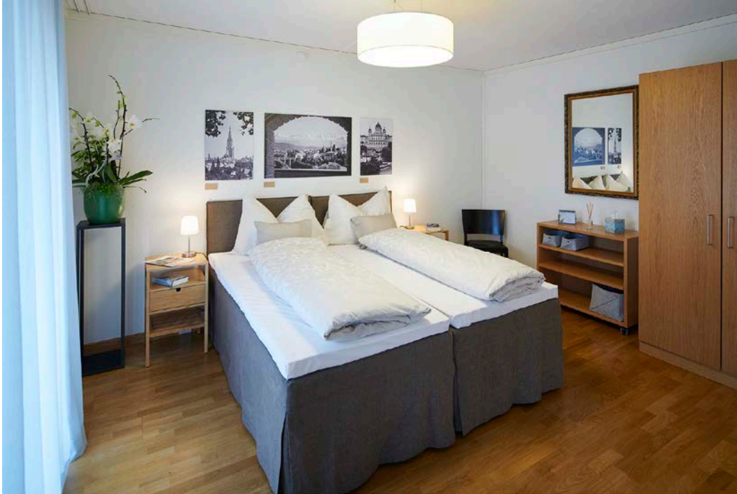
Für einen gesunden Schlaf ist gesorgt – modernes Schlafzimmer mit Boxspringbett